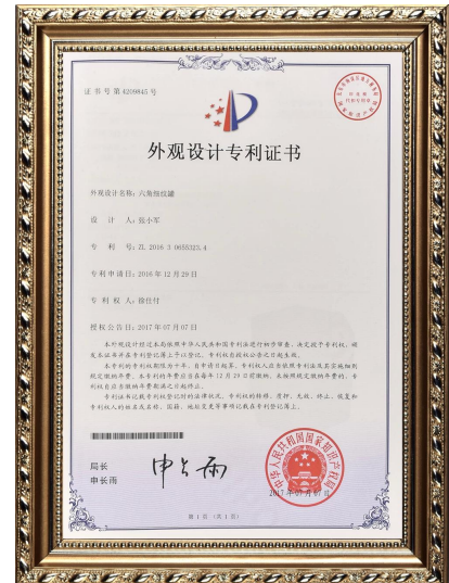
Numéro de brevet: 201630655323.4