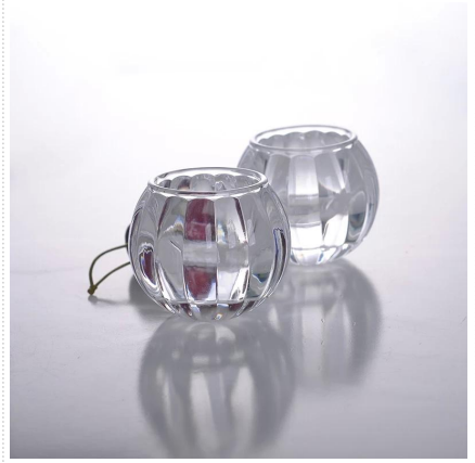
Bougeoir de mariage