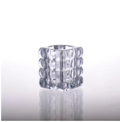
Bougeoir en verre carré