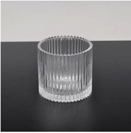
bougeoir en verre clair