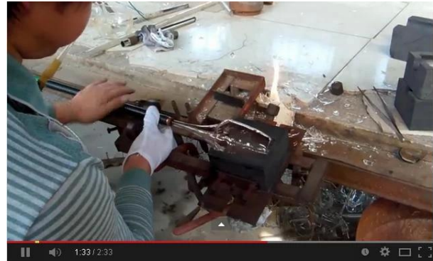
Technique de soufflage à la main