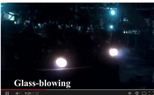
Technologie de soufflage à la machine

Regardez ici notre vidéo de ligne de production en ligne, bienvenue pour nous rendre visite sur place.