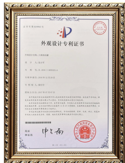
Brevet n °: 20163065523.4