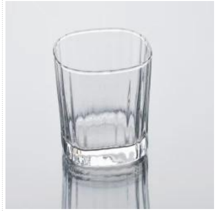
bon verre tasse d'eau