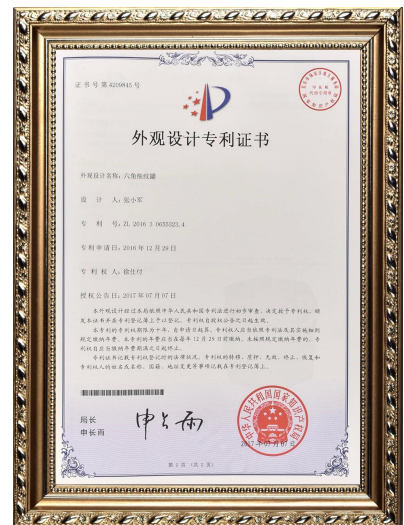
Numéro de brevet : 201630655323.4