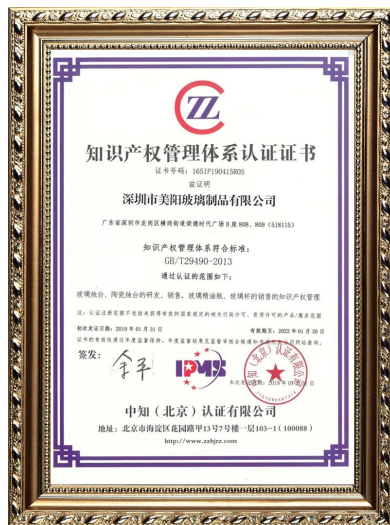
Propriété intellectuelle des entreprises