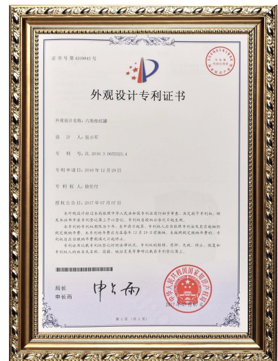
Numéro de brevet: 201630655323.4