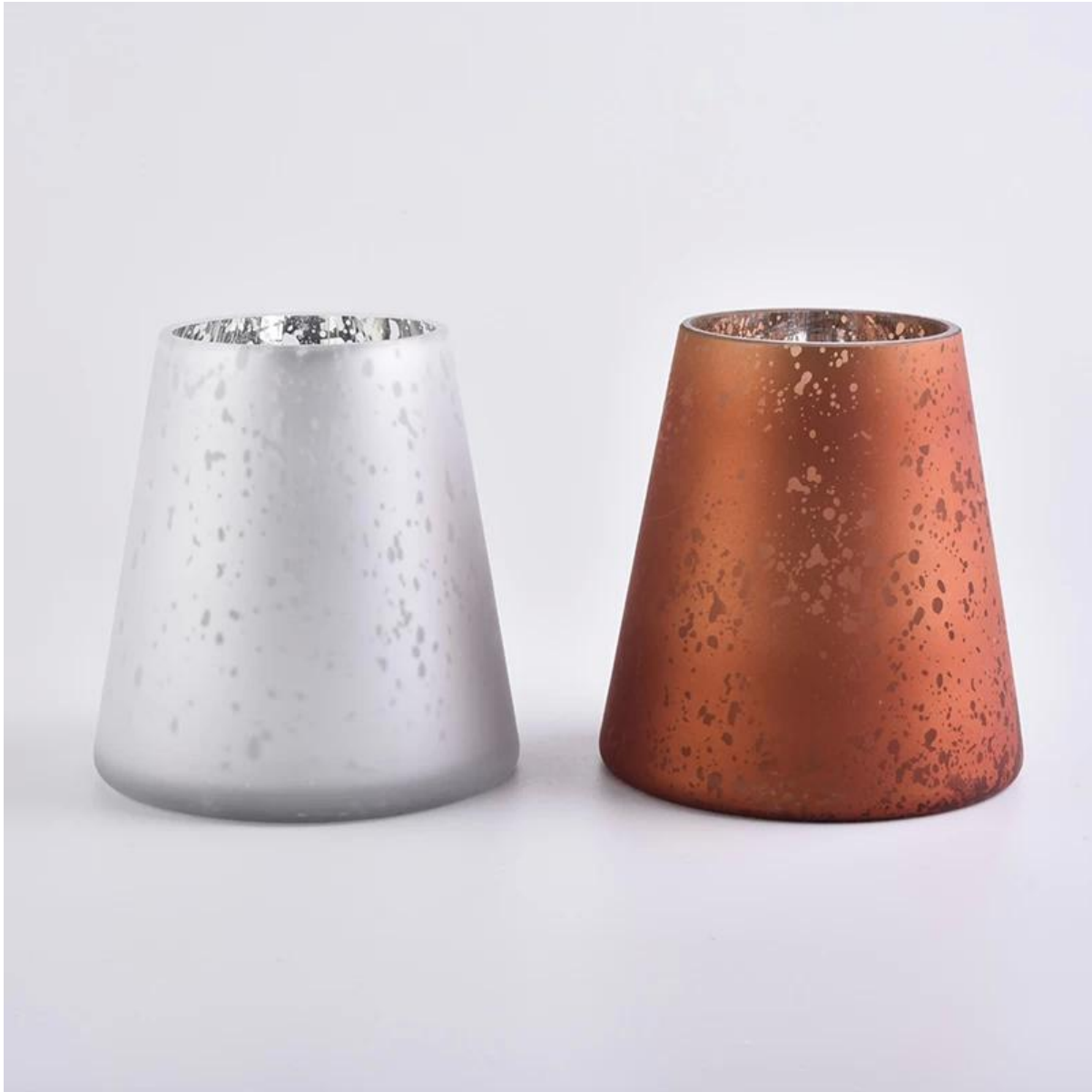
Sunny Brand Story