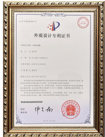
Numéro de brevet: 201630655323.4