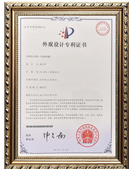
Numéro de brevet: 201630655323.4