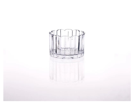
chandelier de verre clair

S Our Company & Sample Room Every day is sunny day