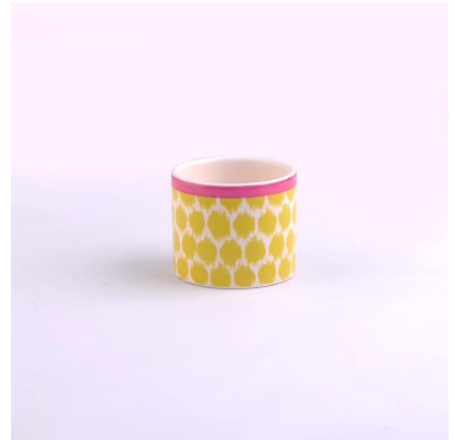
peinture colorée bougeoirs en céramique