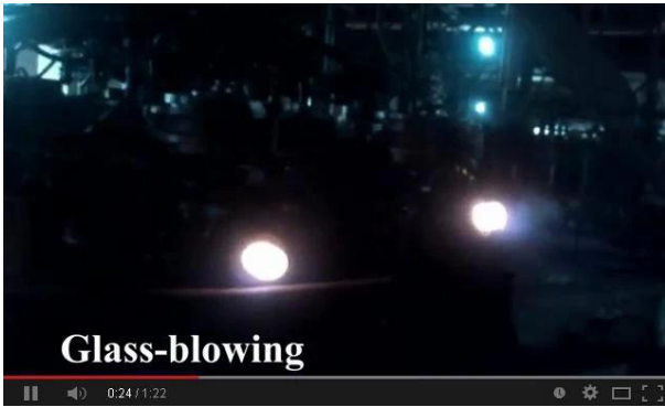
Méthode machine soufflé