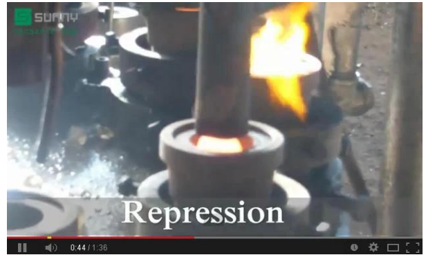
Méthode machine soufflé