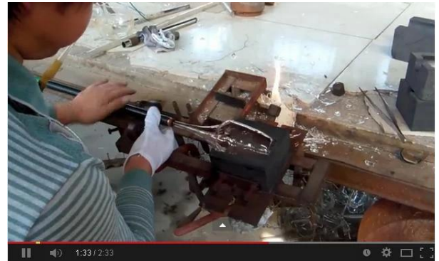
Méthode soufflé à la main