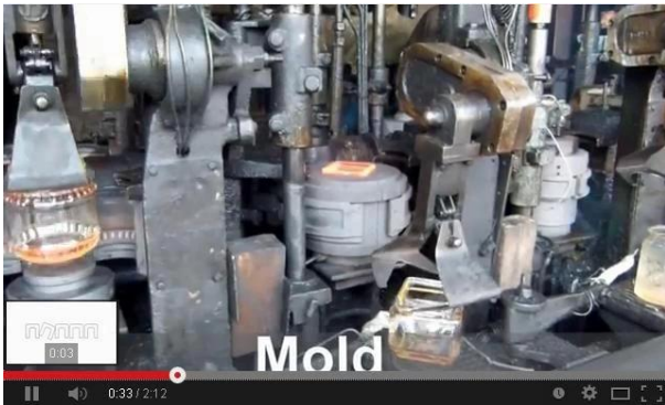
Est la méthode la machine