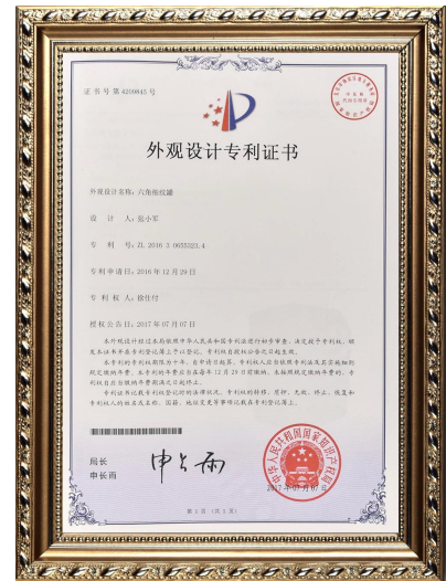
N° de brevet : 201630655323.4