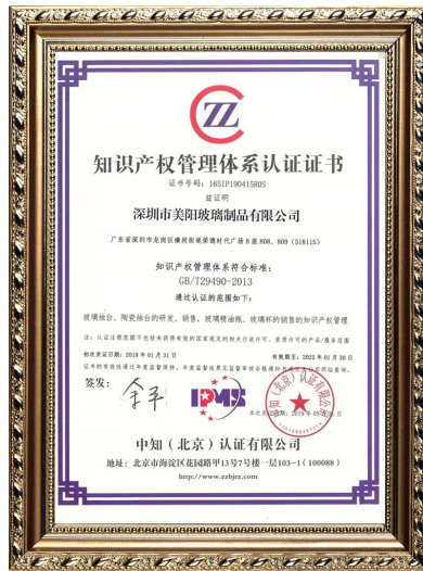
Propriété intellectuelle de l'entreprise