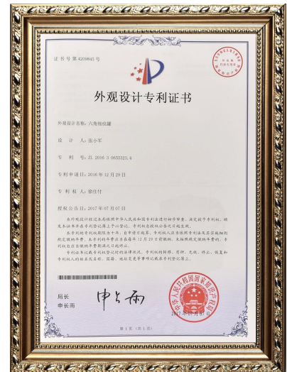
N° de brevet: 201630655323.4