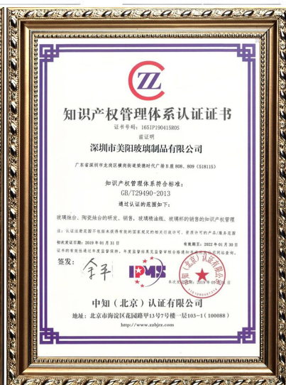
Propriété intellectuelle d'entreprise N ° de brevet: 201630655323.4