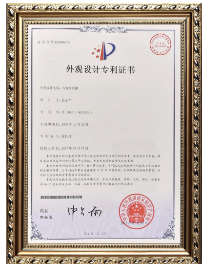
Brevet n. 2.201630655323.4