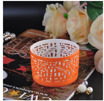
Votives colorés en gros