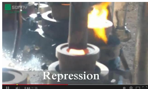
Technologie de la presse mécanique