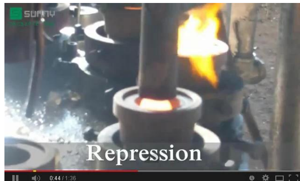
Technologie de la presse mécanique