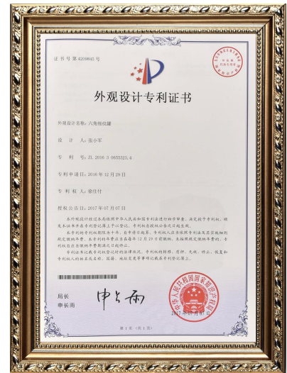
N° de brevet: 201630655323.4