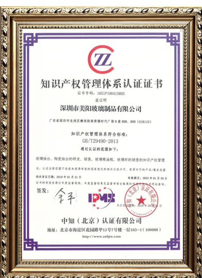
Propriété intellectuelle de l'entreprise N° de brevet : 201630655323.4