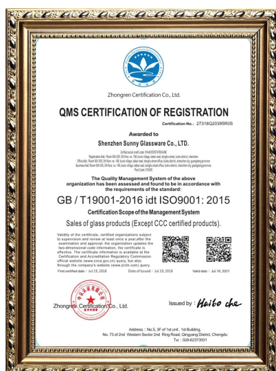
ISO 9001 : 2015