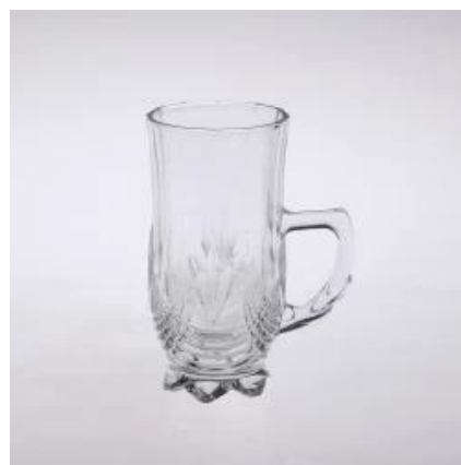
tasse en verre gros