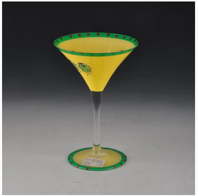
peinte verre à martini à la main