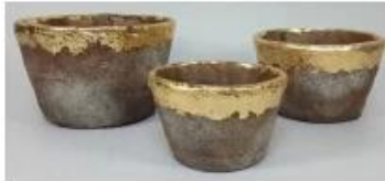
CS10026A-2 20x20x12.5cm CS10026B-2 17x17x10cm CS10026C-2 14x14x9cm