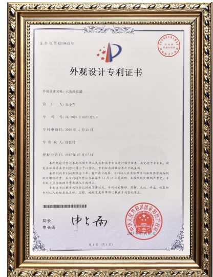
Numéro de brevet: 201630655323.4