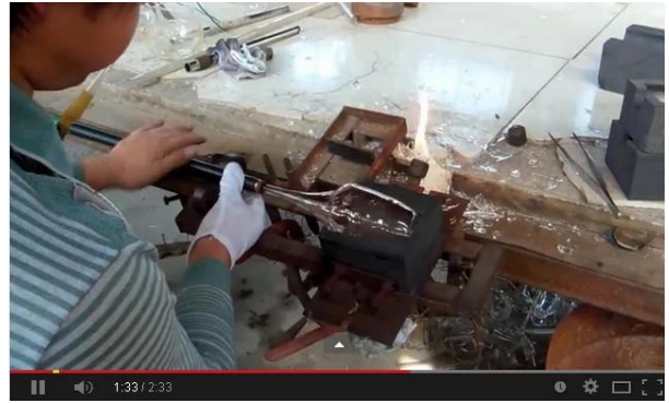
Méthode soufflé à la main