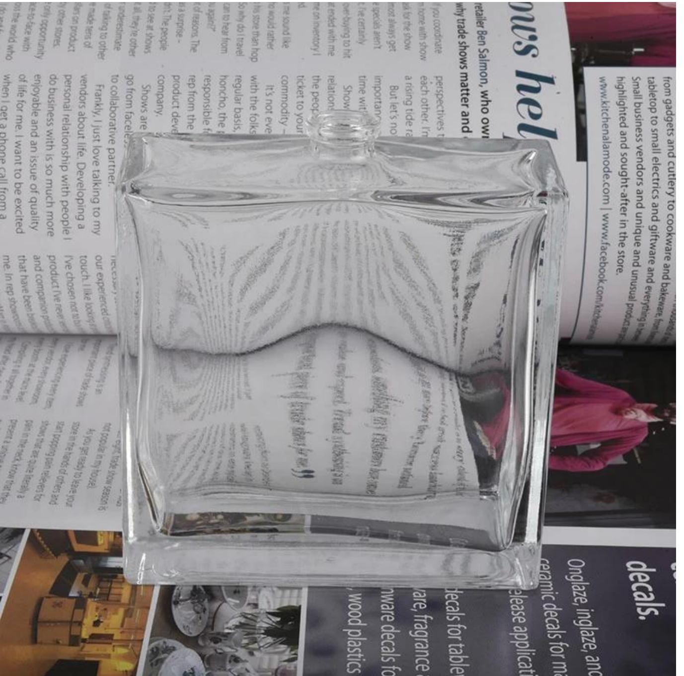
Emballage & expédition