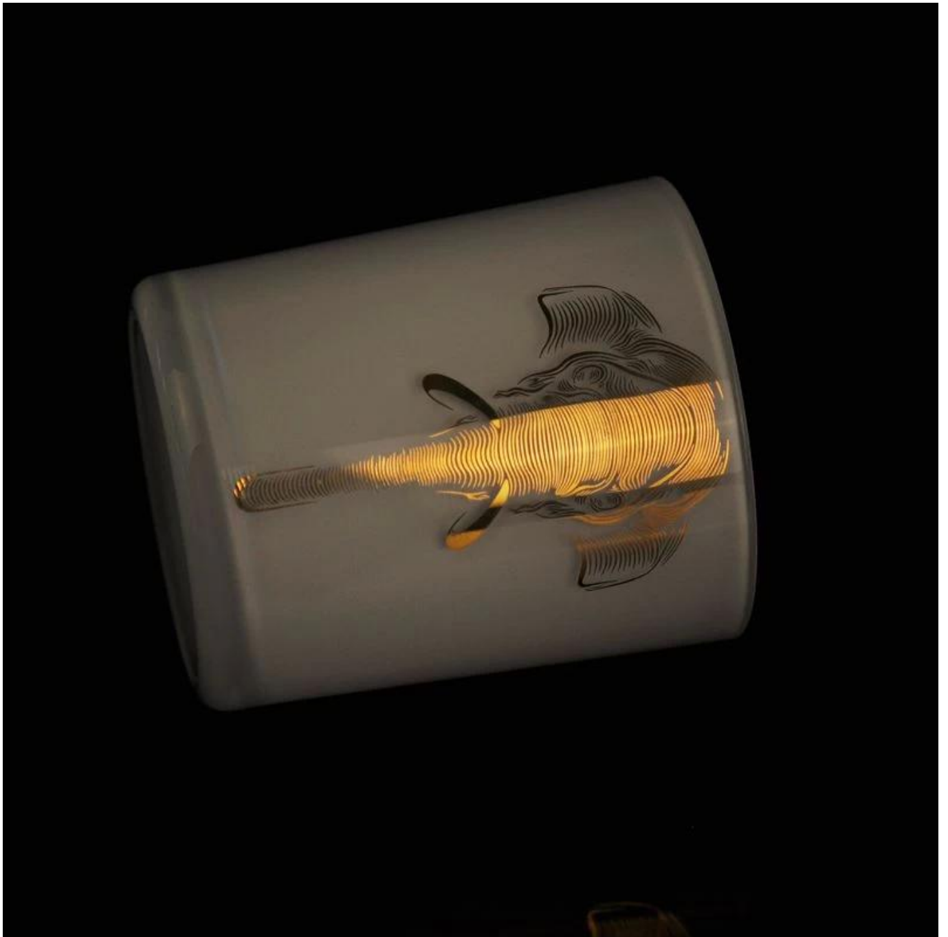
Accessoires de couvercles de bougie: