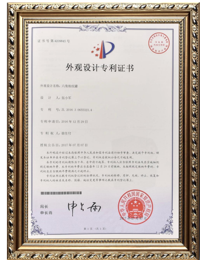
Brevet n °: 201630655323.4