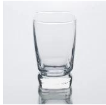
El último diseño de la taza de cristal