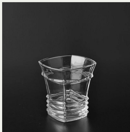
claro vaso de chupito