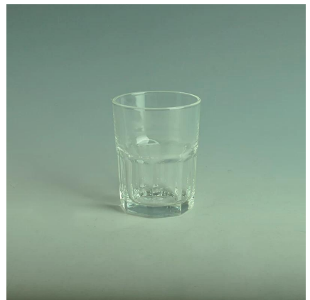
vasos de chupito