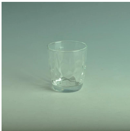
pequeños vasos de chupito