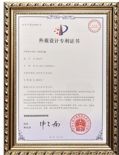
Patente n. 2.20163065523.4