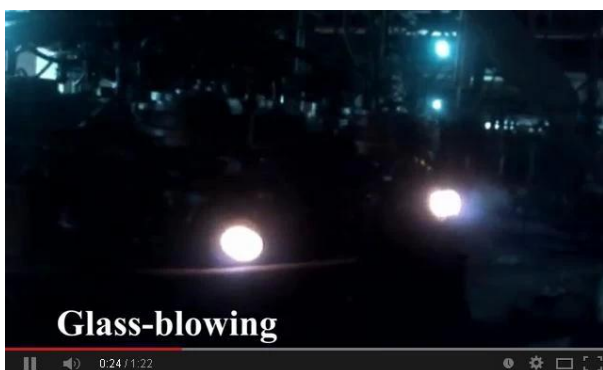
Tecnología de soplado a máquina

Por la presente, vea el video de nuestra línea de producción en línea, bienvenido a visitarnos en el sitio.