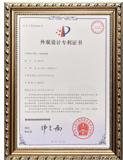
Patente no.: 20163065532.4