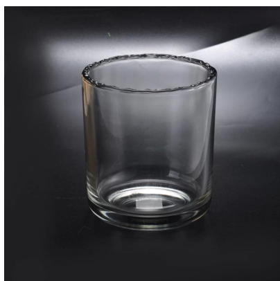
sostenes únicos del cordón del cordón de la decoración casera