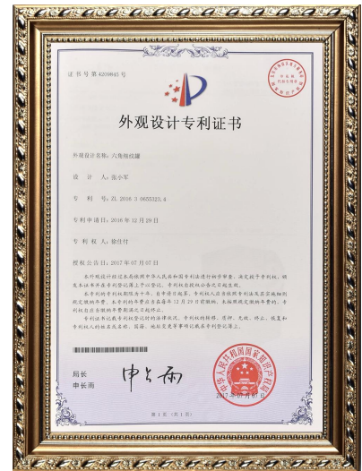
Patente no.: 201630655323.4