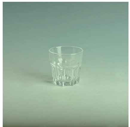
vasos de chupito