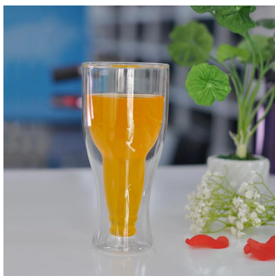
Doble pared doble pared cerveza cristal