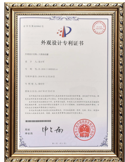
Patente no.: 201630655323.4