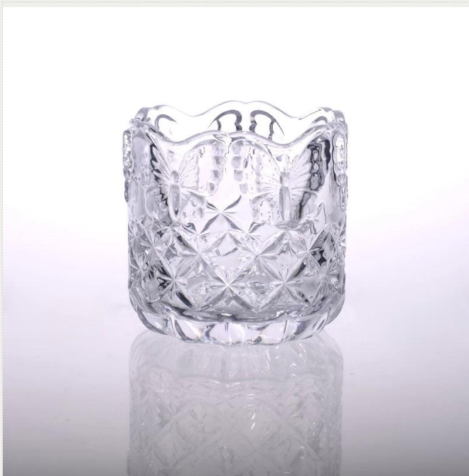
Sostenedor de vela de cristal con el logotipo de la mariposa