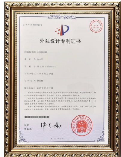
Patente no. : 20163065532.4