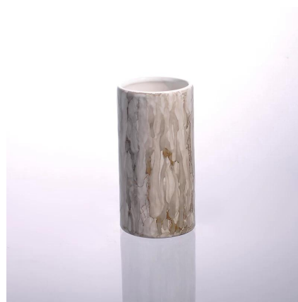
taza de cerámica