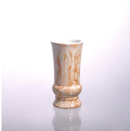
titular de la vela de cerámica artistas