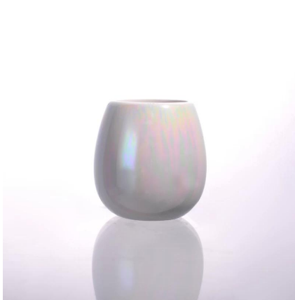
porta velas de cerámica al por mayor