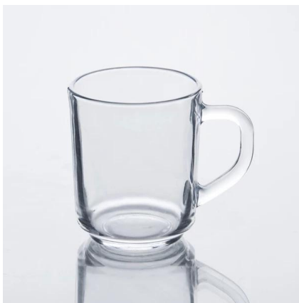
taza de cristal de agua clara