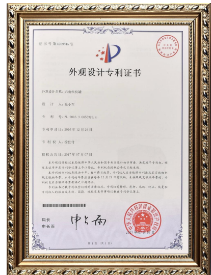
Patente n. 2.201630655323.4