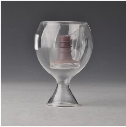
Borosilicato especial taza de cristal