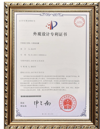
Patente no. : 201630655323.4