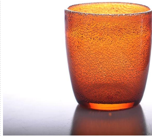
burbuja candelabro de cristal de colores