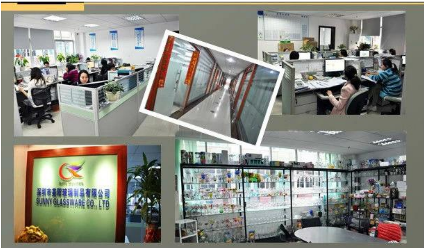
Espectáculo de la fábrica: